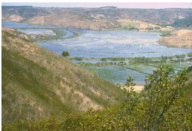
Fig. 2 : Ribeira de Aljezur em fase estuarina e em fase lagunar.

O desenvolvimento da fase lagunar é mais frequente em Aljezur (e.g 1982, 1983, 1986) do que em Seixe (e.g. 1980, 1981).